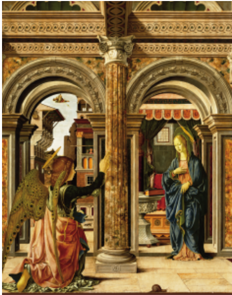
©Francesco del Cossa - 1478 - Bologne